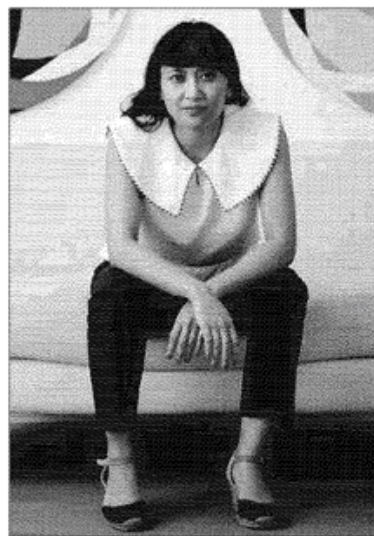
Nota a livello internazionale L'artista britannica ha effettuato una mostra durante le Olimpiadi di Londra e ha appena dipinto il ponte di Canary Wharf Group: è molto conosciuta anche per i suoi murales che ha realizzato in varie parti del mondo